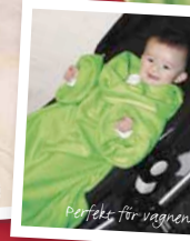
Perfekt för vagnen

Filten CozyOne köper du enklast hos våra återförsäljare: