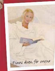
Finns även för vuxna